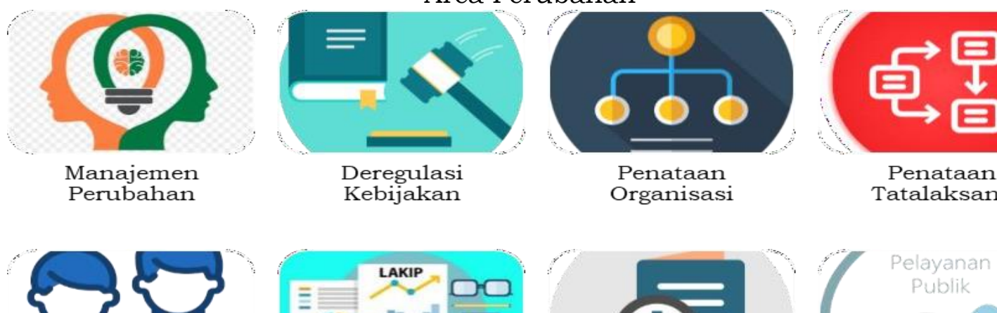
Gambar 2. Area Perubahan

Area Reformasi Birokrasi dan filosofi dibalik desain Reformasi Birokrasi tersebut dapat dievaluasi melalui umpan-balik hasil pelaksanaan Reformasi Birokrasi itu sendiri. Dalam hal ini terdapat delapan area perubahan dalam Reformasi Birokrasi yang menjadi fokus pembangunan antara lain sebagai berikut: