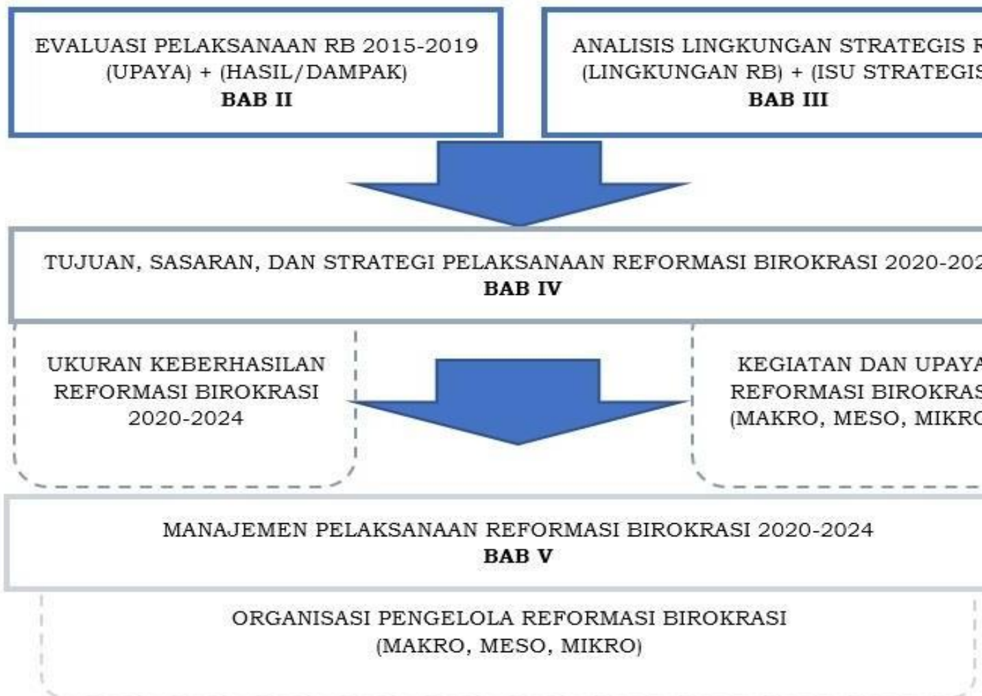
Gambar 1. Kerangka Pikir dan Keterkaitan Antar Bagian Road Map Reformasi Birokrasi 2020-2024